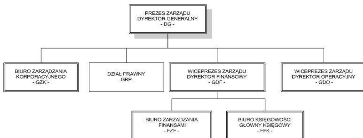
Rysunek 2 Schemat organizacyjny STX Autostrady zgodnie ze stanem na 30 czerwca 2009 roku

Zatrudnienie zostało zwiększone i według stanu na dzień 30 czerwca 2009 roku wynosiło 25 osoby (22 ¼ etatu).